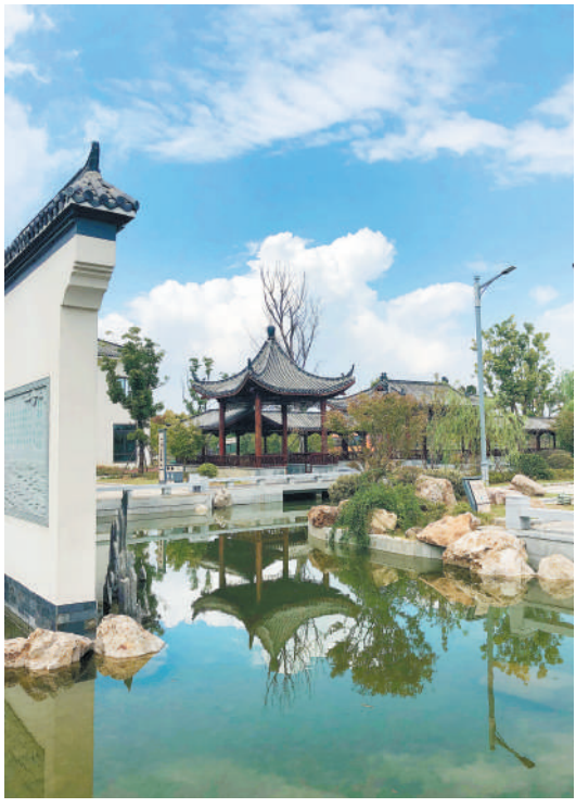
《风景怡人》 蓝天碧水风景优，流连忘返生态美。