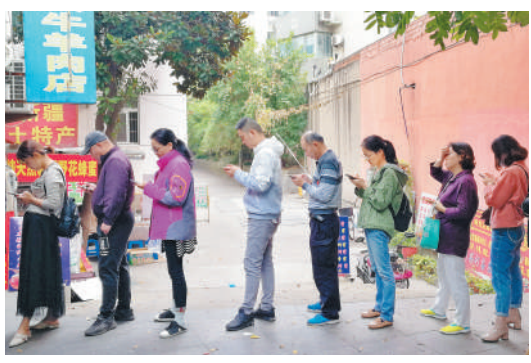
《手机时代》 排队等候时，不管男女老少，纷纷玩着手机，已然进入手机时代。

图片内容：1、积极向上；2、吸引读者；3、标新立异，不得抄袭；4、附上图片题目、说明、拍摄地点、时间等信息；5、注明拍客的姓名，联系方式及通讯地址等详细信息。 投稿方式：1、发送邮件到 hjtbs@qq.com2、加 QQ1084748346 发送离线文件。我们每期将挑选3-5幅作品刊登，采用的作品将发放一定稿酬，以资鼓励。