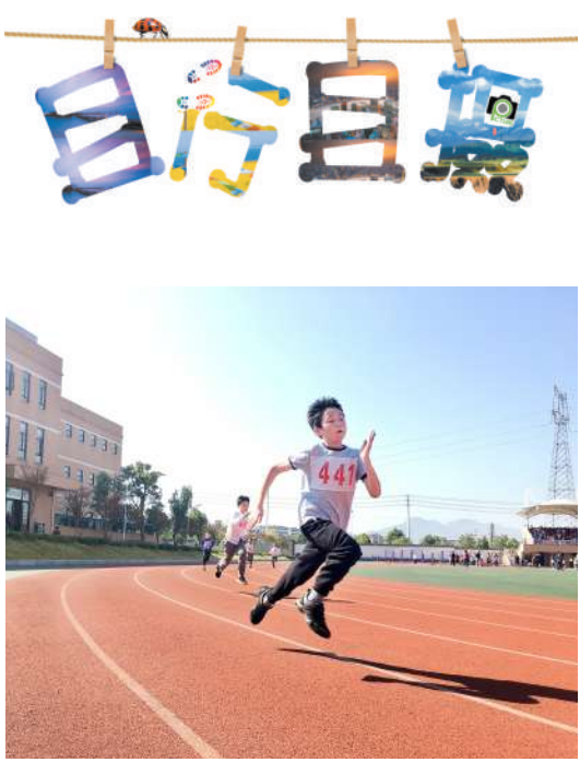
《飞奔》 运动小将们像飞驰的汽车一样，带着必胜的决心，向着终点全力奔跑。

不是第一次 也不是最后一次 驱车几十里 去家乡集市 追寻根的痕迹 小时候 常常拽着母亲的衣角 在这个集市上挤来挤去 至于买过什么 已然忘记 再后来 独自赶集 买些针头线脑 和赶集的叔叔大爷说说话 看看很多想买却买不起的东西 要说最喜欢 还是年底的集市 看不够摊子上花花绿绿的年画 闻不够香气扑鼻的味道 在拥挤中享受年之将至的惬意 家乡的集市 有我熟悉的面庞 有我听惯的方言 纵使大街小巷换了新装 却依然深藏着 千丝万缕的乡情根须 (李林杰)