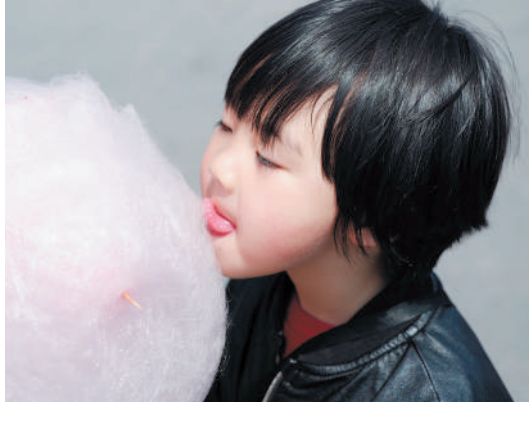
《棉花糖》 棉花糖是属于童年独一无二的记忆。那松软甜蜜的口味，让孩子们爱不释手。