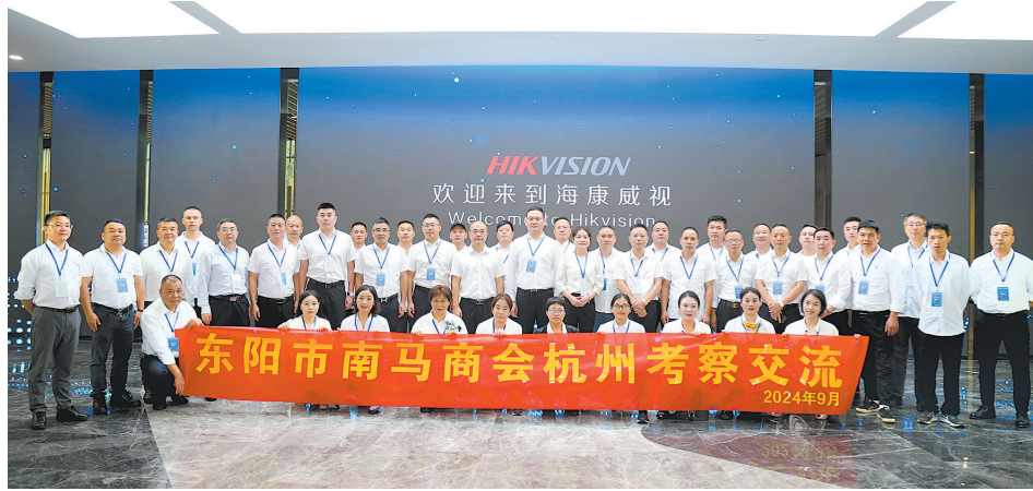
图为东阳市南马商会考察团在海康威视合影留念。

9月26日至27日，东阳市南马商会近50名企业家组成考察团奔赴杭州，对涉及多个领域的多家杰出企业进行考察交流，积极走出去，努力学回来，灵活用起来，致力为南马镇经济社会高质量发展贡献企业力量。