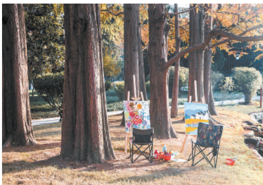
热气腾腾干活忙，出笼馒头喷喷香。