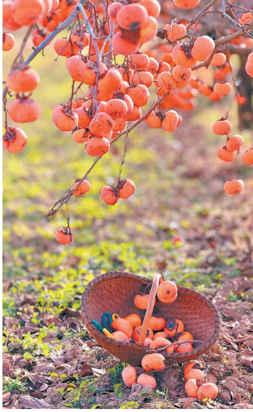
湖畔旁，画架陈，待绘写生景。