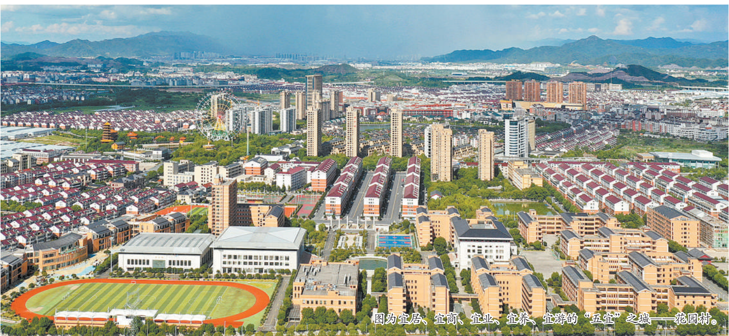
图为宜居、宜商、宜业、宜养、宜游的“五宜”之城——花园村。

1月初，气象预报显示，天津市将接连出现两次弱冷空气过程。同时，天津市环境气象中心与天津市儿童医院（天津大学儿童医院）联合发布预报：天津市儿童流感气象风险等级为3级中风险，并通报了防护措施建议。